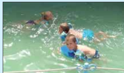
Ügyes óvodásaink az úszás fortelyaival ismerkedtek