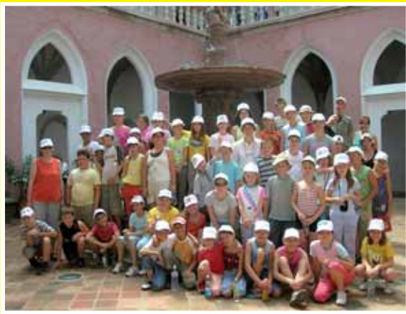
Az idei Fürkész tábor a reneszánsz jegyében zajlott