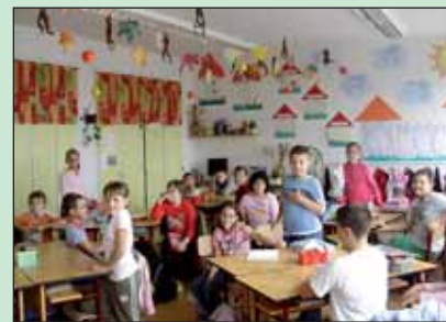
Az új tanterem

Ezen a nyáron is bőven volt feladatuk a kollégium dolgozóinak. Két nagy tábor lebonyolítása mellett jelentős átalakításon van túl az intézmény.