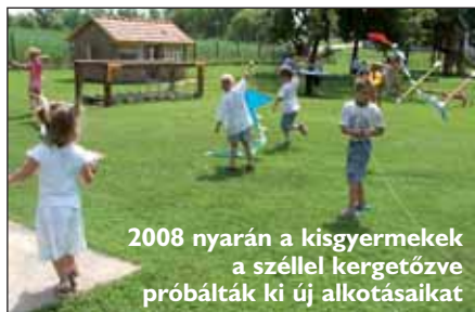
2008 nyarán a kisgyermek a szízzel kergetőzve próbálták ki új alkotásaikat