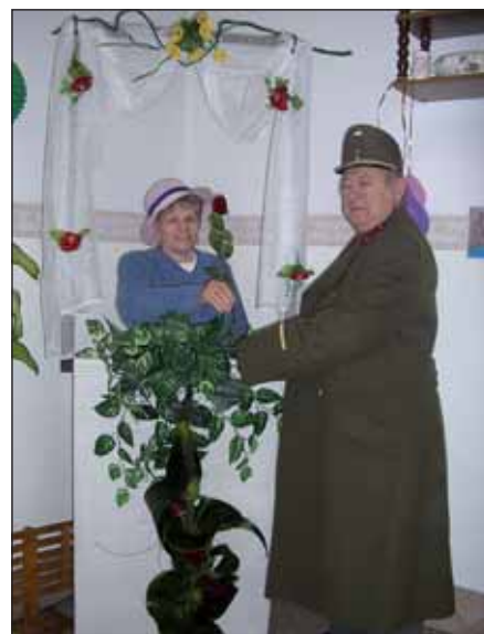
Színjátészó körü pillanatkép

Bárki, aki kéri a klubtagsági felvételét, tizennyolcadik életévét betöltötte, egészségi állapota vagy idősora miatt szociális és mentális támogatásra szoruló, önmaga ellátására részben képes.