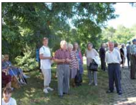
Kirándulás Kecskemétre, az Arborétumba

Igen. Alapító okiratunk szerinti feladatainkhoz igazodtak szakmai rendezvényeink: tavasszal a gyermekvédelmi konferenciát, októberben az időseket és hozzátartozóikat érintő, érdeklő programokat, és az idén novemberben – újszerűsége ebben áll – külön az egészségügyi jellegű programokat, szűréseket rendezük meg.