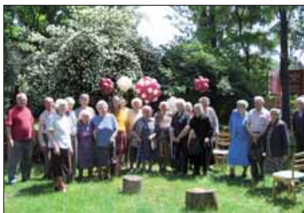
Kikapcsolódás a helyi parkban

Tréfásan azt is mondhatnám, hogy az időskor határát meghúzó tudós ember életkorától függ, hogy kit tekint idősnek, vagy azt, hogy ki milyennek érzi magát, milyen az egészségi állapota, élettereje, vitalitása. Mindenesetre koronként, szakemberként változik annak megítélése, hogy kit tekint idősnek. Az életkorhatár növekedésével az idősnek tekinthető emberek életkora is kitolódott. Egy példával megvilágítanám: nemrég 55 évesen a nők nyugdíjba vonultak, őket idősnek kezelte a társadalom. Ma egy 55 éves ember aktív, tevékeny. Idősnek a szakirodalom a 70 év feletti nőket, férfiakat tekinti.