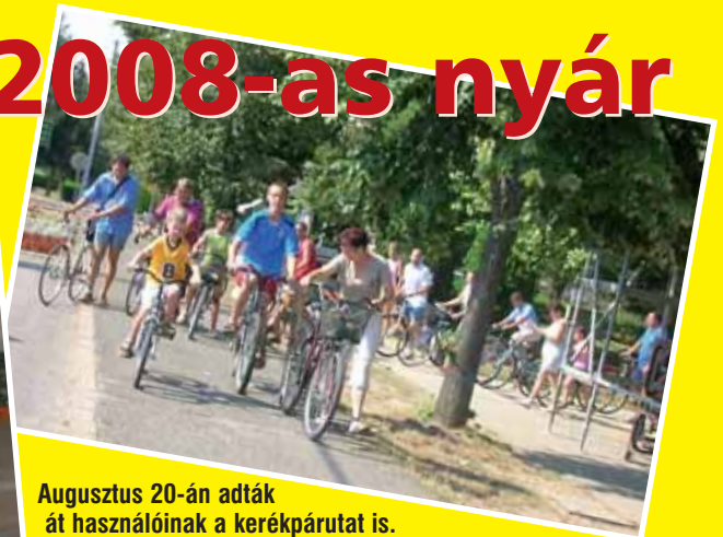
Augusztus 20-án adták át használóinak a kerékpárutat is. Örömmel tapasztalható, hogy településünkön egyre többen pattannak csak úgy bringára vagy csatolják fel a görkocsolyát.