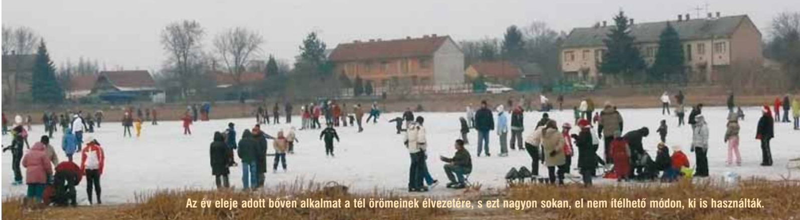
Az év eleje adott bőven alkalmat a tél örömeinek élvezetére, s ezt nagyon sokan, el nem ítéhető módon, ki is használták.