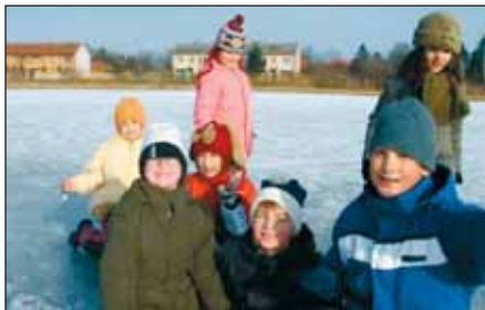
A Csibe csoportos gyermekek kipirult arccal élvezik a tél örömeit