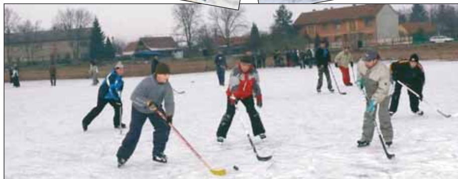
A képek Rigó Pál munkái