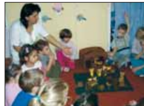
Bemutató-foglalkozás a Micimackó csoportban