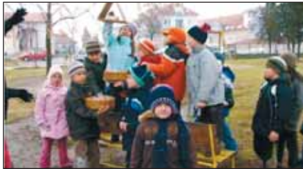
Óvodásaink gondoskodnak az éhezõ kismadarokról