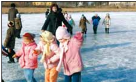
Óvodánk Ózike csoportosai vidáman csúszkálnak a jégen