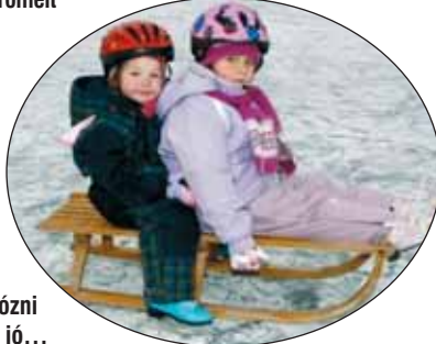
Szánkózni csuda jó...