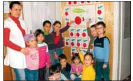
Mécses csoportos gyermekek ismerkednek a dohányzás-megelőzési programmal

Az idei tanévben egy tudományos kutatásban vesz részt a mi óvodánk. A kutatás során a Dohány-