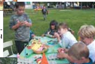
A Mécses csoportosok játékos ügyességi versenyen vettek részt.

Az Őzike csoportosok tojástartó kishajót készítettek