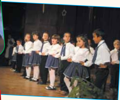
A Napocska csoportosok elvezettek bennünket egy vásári forgatagba