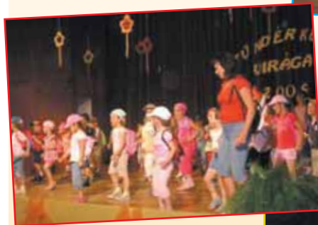
A Csibe csoportosok hátizsákkal a hátukon „kirándulni” indultak