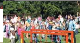
Táncház a Süni csoportban

Közös zenés tornával indult a gyermeknap a központi óvodában.