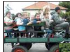
A Rákóczi u.-i óvodások boldogan kocsikáztak

Közös zenés tornával indult a gyermeknap a központi óvodában.