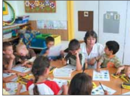
Ismerkedés az anyagokkal a Mécses csoportban

A gyerekek ismeretei tovább bővíthettek, amikor a környezetvédelmi napon a Saubermacher Kft. alkalmazottjai eljöttek az óvodába, hogy a gyerekek közelről megismerkedhessenek a „kukás” autóval működés