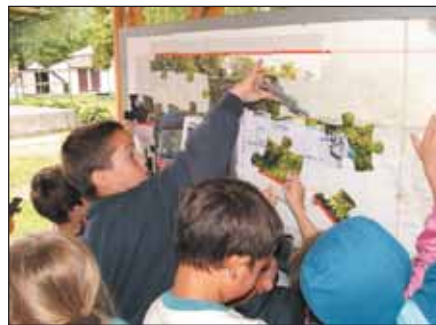
Az Őzike csoportos gyerekek kukásautó kék-pét rakják ki a kirakóval

közben is. A cég által hozott játéktevékenységek műanyag flakonok taposása, kupakkal célba dobás kukába és kirakó játékok színesítették a gyerekek napját.