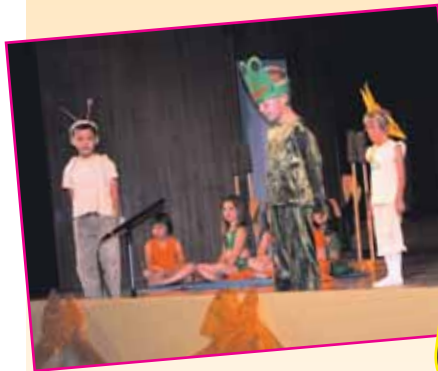
A „Világszép kecskebéka” története a Szent I. u-i óvodások előadásában

Az idén is megrendezésre kerül a „Tündérbkert Virágai” Gála, melyen ügyes óvodásaink színvonalas előadásokat mutattak be.