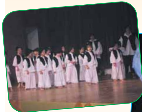
A Katica csoport gyermekei libapásztor lányokká és juhászbojtárokká változtak a színpadon.