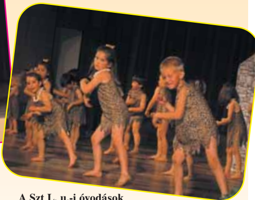
A Szt L. u.-i óvodások a Flinstone család mindennapjait mutatták be