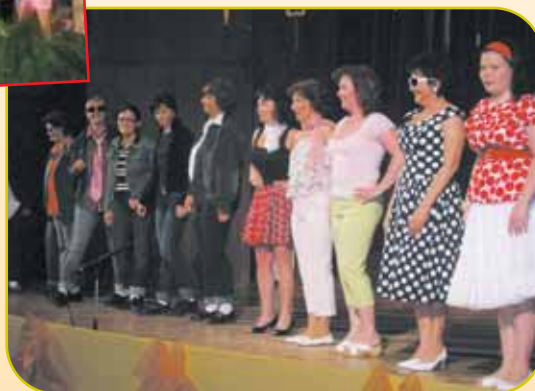
A műsort az óvó nénik tánca zárta