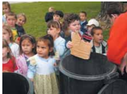
A Méhcske csoportosok szelektíven válogatták a hulladékot