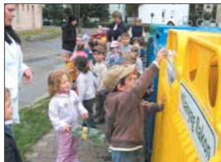
A Süni csoportosok az összetaposott műanyag palackokat elhelyezik a gyűjtőkönténerbe.