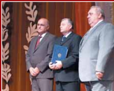
Lajosmizse Város Településtelejesztéséért Díját a lajosmizsei Tanyacsárda Kft. vehette át