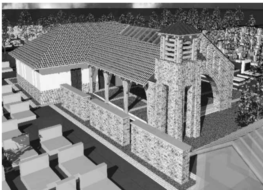
É-11 LÁTVÁNYTERV 4.

Az építési munkálatok befejezéséig kérjük a lakosság türelmét és megértését.