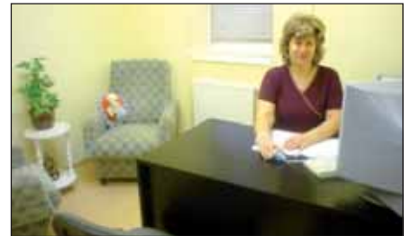
Egészségügyi szolgáltatások új helyei az Egészségházban

Óvó nénik, Gyermekek „Tündéerkert” Alapítvány Kuratóriuma