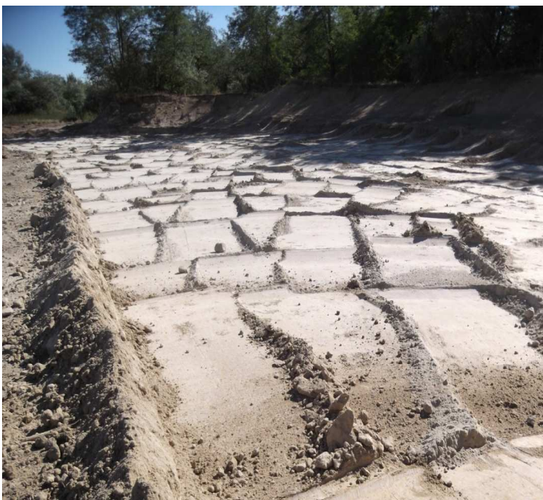
Szennyezett talaj lefejtése