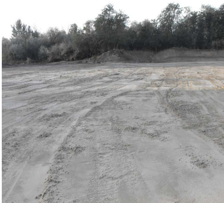
Humuszban gazdag fedőréteg kialakítása