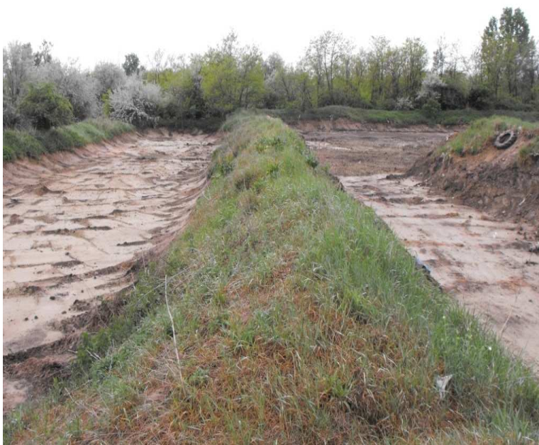
Komposztálódott iszap kitermelése