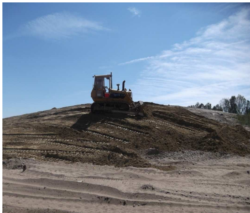
Humuszban gazdag fedőréteg kialakítása