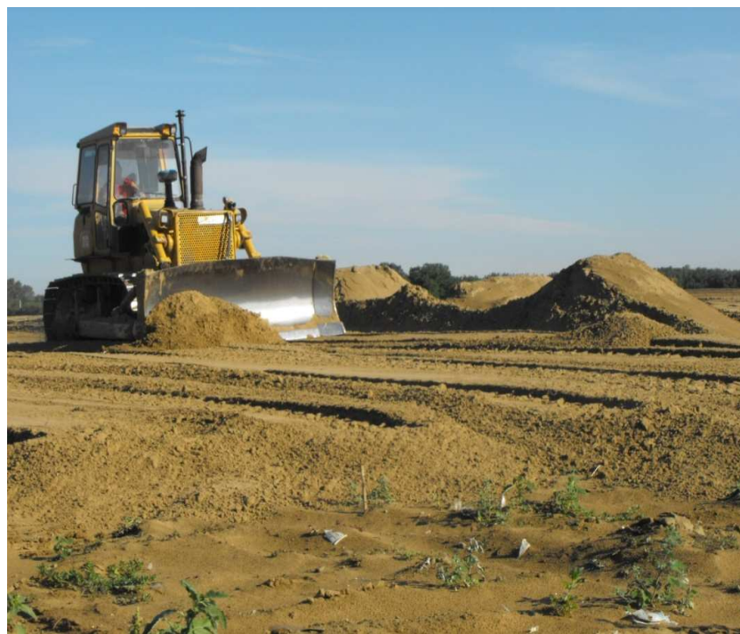
Ásványi szigetelőréteg kialakítása