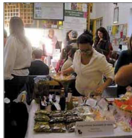
Az Egészség-Expo kiállítói és portékái

Az Egészség-Expo kiállítói is remek munkát végeztek, hiszen – visszajelzésük alapján – a mustra eredményeképpen megrendelőik száma is gyarapodott.