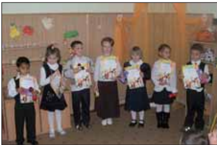
A helyezett gyermekek az oklevéllel és az ajándékkal