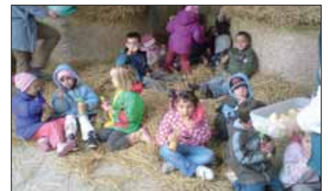
Játék után jólesik a harapnivaló a szalmabálákon