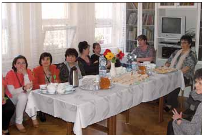
A Meserét óvodában szakmai napon vettek részt a salgótarjáni óvoda dolgozói, akik a helyi IPR programmal ismerkedtek