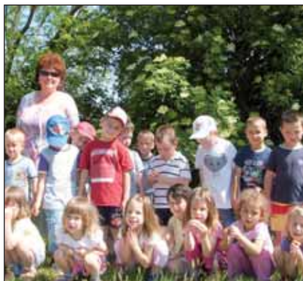
A Méhecskék megpihentek a bodzafa alatt

2012. május 10-én felfedezőútra indult a Méhecske csoport a lajosmizsei határba. Utunk az óvoda melletti tó partján vezetett, ahol tücskök és békák hangját figyelhettük meg. A tóból a vadkacsák és szárcsák serege rebent fel, mikor éppen arra jártunk. Ennek öröme mi is átváltoztunk békává, kacsává a hangjukat, mozgásukat utánozva. Énekelünk, verseltünk róluk. A nagyítóval megnéztük az apró fűben rejtőzködő élővilágot. Észrevettük, hogy milyen szépen sarjad a vetés (kukorica, búza árpa). A gabona táblák mellett gólyahírt, pipacsot és búzavirágot láttunk. Fejünk fölött elrepült egy gó-