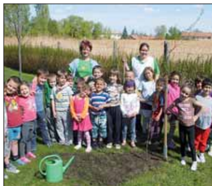
A Napraforgó csoport Föld napján fát ültetett az óvoda udvarán