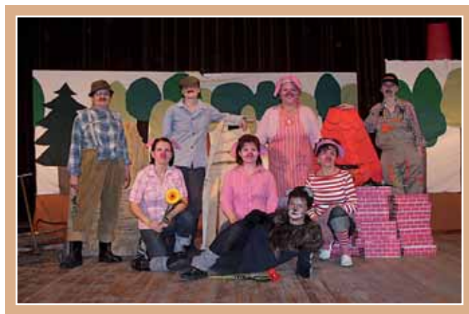
Az óvó néni áprilisban meseelőadással (A három kismalac) örvendeztették meg a kis óvodásokat