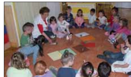
Zöldségfélék válogatása az Őzike csoportban a bemutató foglalkozáson