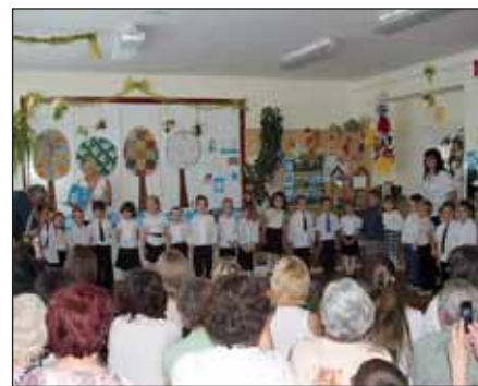
A Csibe csoportosok versekkel, énekekkel köszöntötték az édesanyákat és a nagymamákat