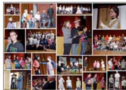
A döntő pillanatképei