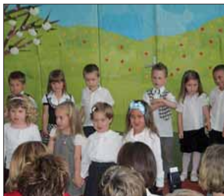
A kis Katicások első Anyák napi ünnepe