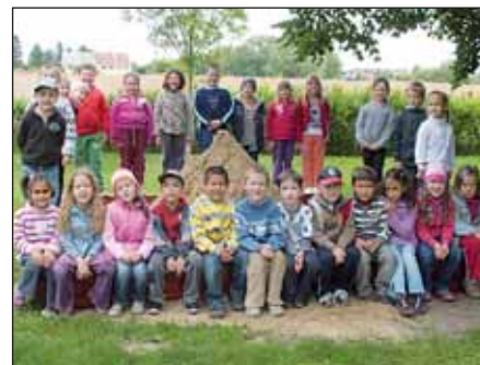
A Napocska csoport birtokba vette az udvaron az új homokozót

Óvó nénik, Gyermekek „Tündérkert” Alapítvány Kuratóriuma